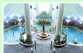
アクアーレ長岡 車で約10分 4.5km