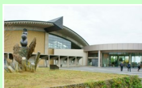
県立歴史博物館 車で約10分 4.4km