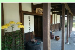
江口だんご本店 車で約4分 1.1km