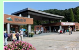
国営越後丘陵公園 車で約12分 5km