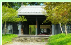
雪国植物園 車で約7分 2.6km